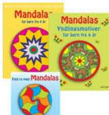
Mandalas malebøger, kr. 135,00 Fantastiske motiver der fanger børns opmærksomhed.