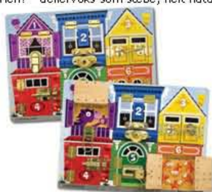
Låsebræt, lås op, lås i... kr. 295,- Dette bliver en ny bestseller! 6 låger med hver sin låsemekanik, det vil dit barn elske.

Tilbud til modtagere af nyhedsbrevet - 3 dage med rabat. Få 10% rabat på alle de viste varer i dette nyhedsbrev, skriv "nyhedsbrev" i bemærkninger når du bestiller varer, og vi trækker 10% fra i rabat. Gælder frem til d. 22/6-2008