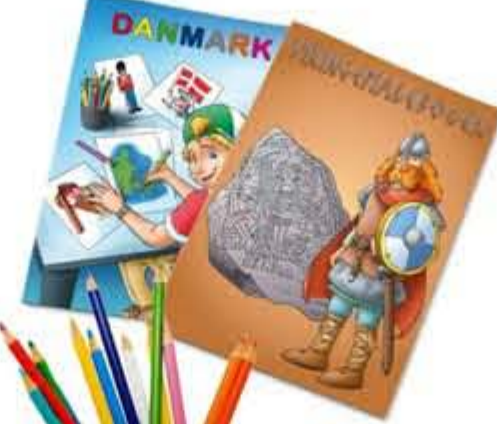
Danske malebøger+farveblyanter kr. 99,- 2 lækre malebøger med motiver fra Danmark og den danske kultur. Lige til Danmarksferien!