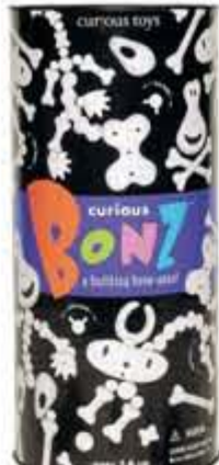
Bonz skelet byggesæt kr. 249,- Skørt og fantasifuldt byggesæt, hvor der bygges sjove figurer.