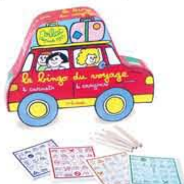
Bilbingo, kr. 98,00 Bingo på bagsædet.

Se et par eksempler her, eller klik ind på vores feriekategori: Legetøj til ferien