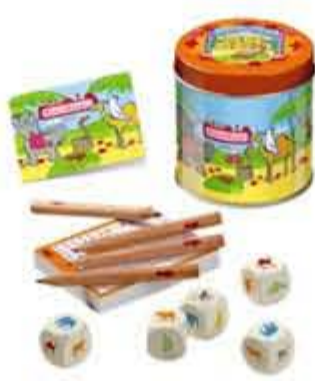
Yahtzee med dyr, kr. 79,95 Herligt familiespil med tvist af nyskabelse.