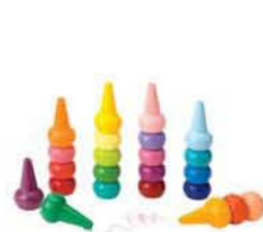
Fingerfarvelader kr. 175,00 24 anderledes farverlader, der skaber kreativitet til fingerspidserne.

Se nogle af nyhederne herunder, alle nyhederne finder du her: Nyheder fra Legeakademiet