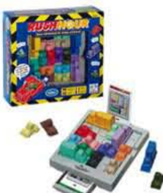
Rush Hour, kr. 149,00 Trafik-logik på bagsædet!