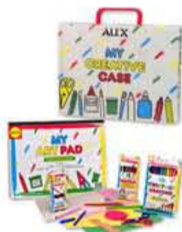
Kreativ kuffert kr. 299,00 En kuffert fyldt med kreative redskaber - lige til at tage med på ferien.