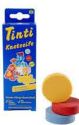
Modellørsæbe til bad kr. 59,- Gør badetid til kreativ tid! Sjov modellørsæbe som sæbe, helt naturligt.