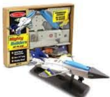
Built a jet-plane kr. 249,- Lækkert byggesæt af træ, der bliver til flot jetjager. Alt i en boks.