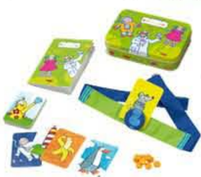
Hvem er jeg, kr. 89,95 Et kreativt gættespil for hele familien.