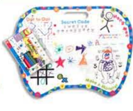
Underholdningsboard, kr. 159,00 En whiteboard-plade fyldt med underholdning.