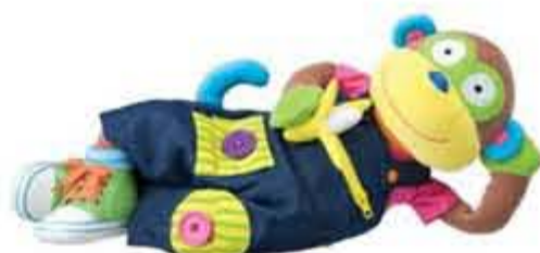
Påklædningsabe kr. 375,00 Fabelagtig abe der lærer barnet at knappe, lyne, binde og åbne/lukke.